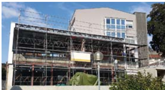
Rénovation de la salle à manger de l'EHPAD Emmaüs-Diaconesses Centre-Ville

Ils permettent également d'abonder le financement de la Communauté des Diaconesses qui ont œuvré toute leur vie professionnelle dans les diverses branches de l'Établissement.