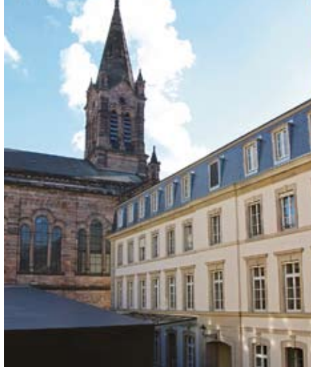
Vue sur la cour intérieure du Gymnase, le Cube et le Temple-Neuf