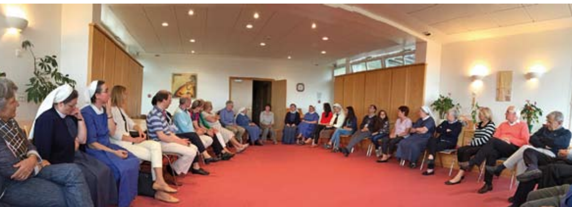
Week-end annuel du Conseil de Surveillance au Hohrodberg