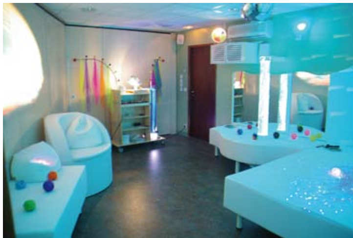
EHPAD Siloë : exemple d'espace Snoezelen

Dans cette optique, l'espace Snoezelen, installé au sein de l'EHPAD Siloë, a pour vocation non seulement d'apporter aux personnes âgées confort, sécurité et relâchement – en faisant appel à l'émotion et à l'affectif par le biais de leur corps et de leurs cinq sens –, mais également d'être un lieu de détente et de ressourcement pour le personnel de l'établissement.