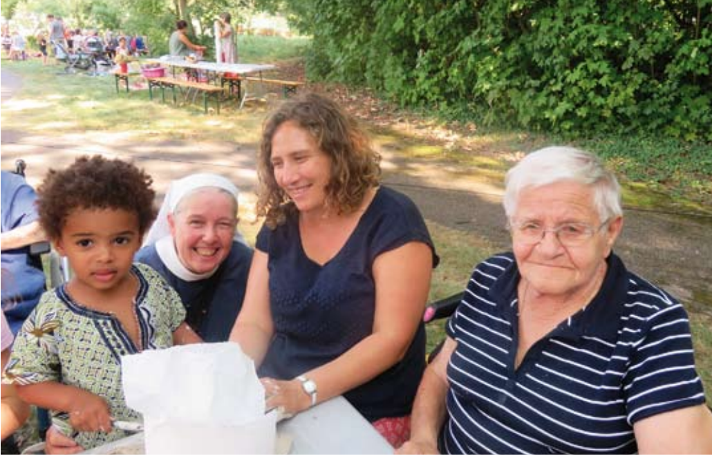
EHPAD Emmaüs-Diaconesses Koenigshoffen « Dialogues en humanité » dans le parc de l'établissement