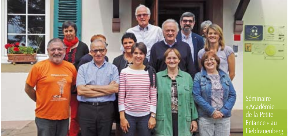
Séminaire « Académie de la Petite Enfance » au Liebfrauenberg

EDIAC Formation est bien l'illustration de la « vie en abondance » qui se manifeste à tous les étages.