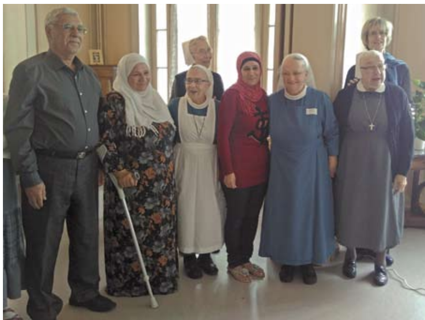
Accueil d'une famille de réfugiés syriens