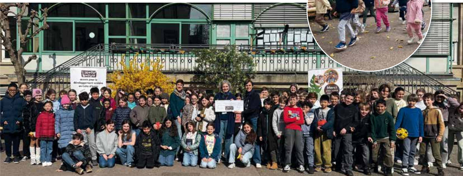
Remise du chèque de dons récoltés lors de la Course de Solidarité à l'Association « Savoir Ivoire »