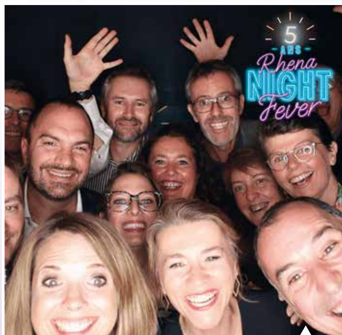
L'équipe de direction de Rhéna

Rhéna est fière de faire partie des entreprises qui ont à cœur de viser l'excellence alsacienne!