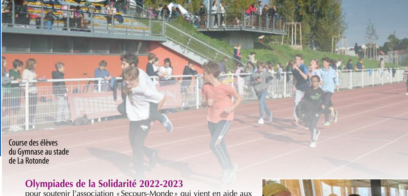
Course des élèves du Gymnase au stade de La Rotonde