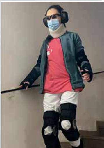
Le salarié est équipé d'orthèses de genoux, de surchaussures pour ressentir le déséquilibre et la limitation des amplitudes articulaires.