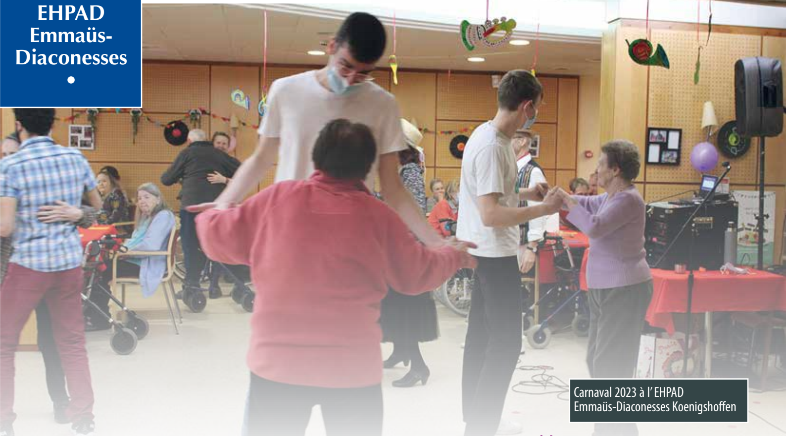
Carnaval 2023 à l'EHPAD Emmaüs-Diaconesses Koenigshoffen