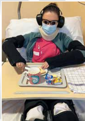
L'amplitude articulaire et la coordination sont réduits, le casque auditif simule la presbycousie, les lunettes un déficit de la vue.

Les retours des salariés sont très positifs. Certains ont été très émus et tous seront encore plus sensibles et bienveillants dans la prise en charge de nos aînés.