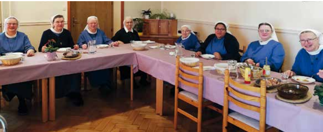
• Repas fraternel au Hohrodberg