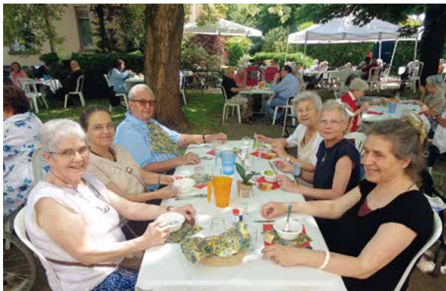
EHPAD Bethlehem – Fête de l'Été

À l'orée de l'année 2023, l'optimisme n'était clairement pas de mise au sein des établissements gériatriques français : une inflation soutenue impactant fortement les budgets, une hausse majeure des prix du gaz et de l'électricité mettant à mal les équilibres financiers, une difficulté de plus en plus prégnante à recruter du personnel, des dommages collatéraux en cascade consécutifs à l'affaire Orpéa.