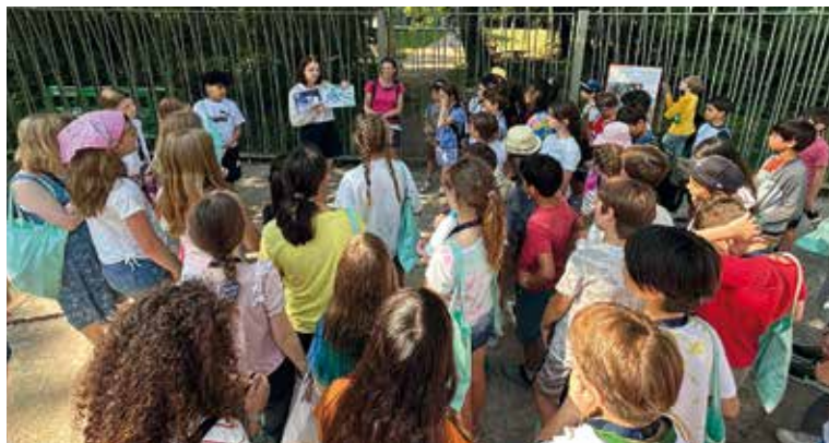
Accueil des élèves de Portland

Les tensions et événements internationaux qui font régulièrement l'actualité montrent combien il est nécessaire de connaître son prochain pour mieux le comprendre.