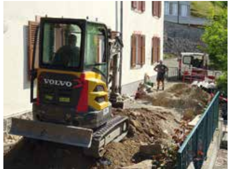
• L'entreprise Basso au travail dans la cour