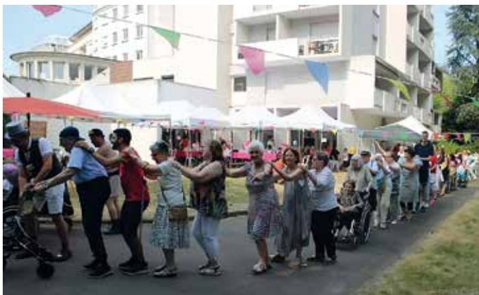
EHPAD Emmaüs-Diaconesses Koenigshoffen – Fête de l'Été 2023