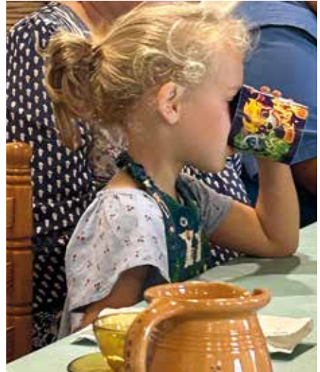
• Joie du petit-déjeuner

Cette année, les retraites liturgiques ont été bien appréciées. La présence d'hôtes très divers est toujours un défi mais la Parole de Dieu rassemble et unit.