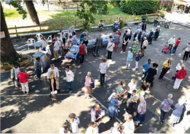
Dimanche 4 juin 2023 • Fête des Jubilés

Cette année a été riche en partages, tant à Strasbourg qu'au Hohrodberg. Dans la Bible, on voit Jésus qui demande à ses disciples de partager du pain entre tous pour nourrir une foule. Les disciples sont ceux qui tour à tour reçoivent, dans leur vie avec Jésus, puis partagent ce qu'ils ont reçu de Jésus.