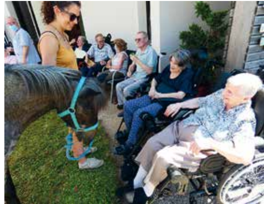
EHPAD Les Quatre Vents Inauguration du parc et médiation animale

Quant aux événements festifs, ils ont jailli le printemps et l'été au travers de fêtes de l'été, de pique-niques, de barbecues, de tartes flambées, de goûters champêtres ou encore de glaces à disposition des résidents, de leur famille et des personnels.