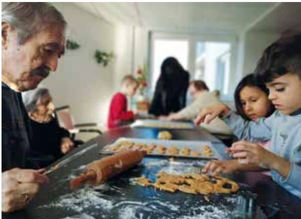
EHPAD Emmaüs-Diaconesses Centre-Ville – Confection de bredele